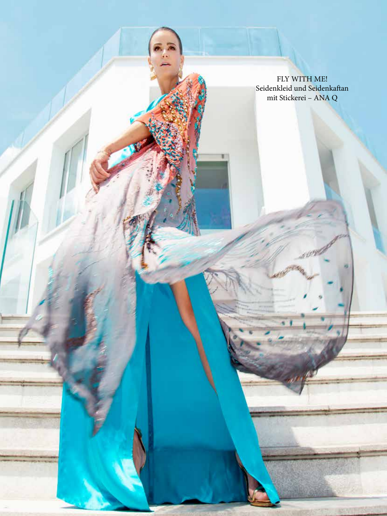
FLY WITH ME! Seidenkleid und Seidenkaftan mit Stickerei – ANA Q