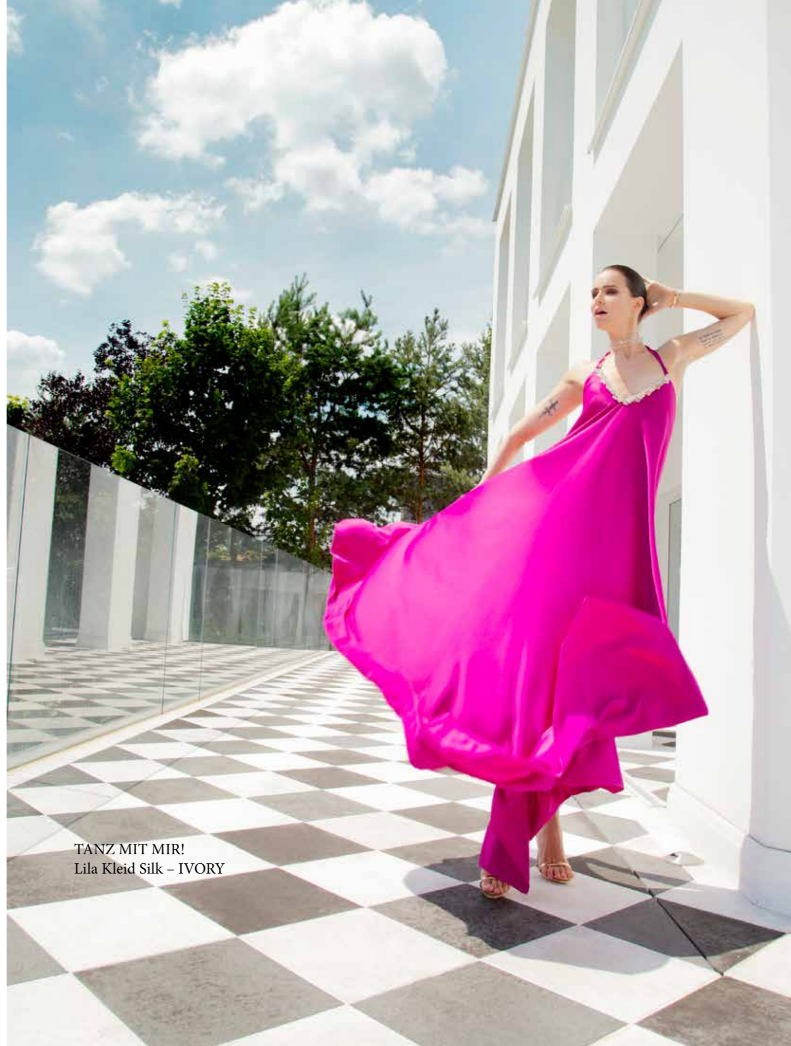
TANZ MIT MIR! Lila Kleid Silk – IVORY